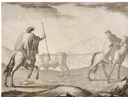
Fig. 3. Enlazando ganado vacuno en Buenos Aires. Grabado Fernando Brambilla

La vista de Buenos Aires desde el Sudeste , fue la imagen más importante de Buenos Aires para el conocimiento sensible de esta ciudad portuaria, que inscribía en el ámbito geográfico a la proyección de la institucionalidad en una representación de una ciudad con el puerto más activo de la región. Brambilla realizó dentro del catálogo visual de las escalas de la expedición además una Vista desde el Río, una de faenas rurales y un incendio en la Pampa.