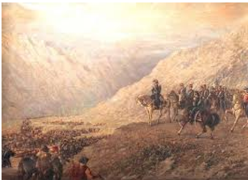
Fig. 17 Augusto Ballerini (1890). "El Paso de los Andes"

En esta dinámica de complejidades, se articula un orden en la que el modelo civilizador propuesto por las capitales europeas era fundante y rector, se produjeron en esos cambios en las costumbres, la sociabilidad y el gusto a lo que contribuyeron reconocidos italianos como Luigi de Servi (1863-1945), formado en la Academia de Bellas Artes. En 1883 viajó a Argentina, donde obtuvo importantes comisiones entre otras, los retratos de los gobernadores de la Pcia. de Buenos Aires, escenas con la vida primitiva del hombre en la entrada del Museo de La Plata y seis frescos para el Grand Hotel en Mar del Plata.