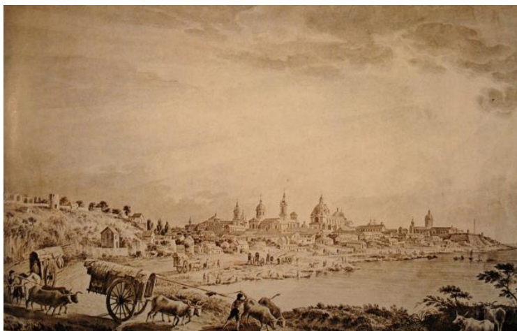
Fig. 2. Vista de Vista de Buenos Aires desde el Sudeste – Fernando Brambilla 1789 6 .

La vista de Buenos Aires desde el Sudeste , fue la imagen más importante de Buenos Aires para el conocimiento sensible de esta ciudad portuaria, que inscribía en el ámbito geográfico a la proyección de la institucionalidad en una representación de una ciudad con el puerto más activo de la región. Brambilla realizó dentro del catálogo visual de las escalas de la expedición además una Vista desde el Río, una de faenas rurales y un incendio en la Pampa.