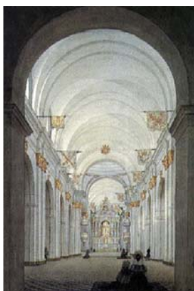
Fig. 6. Interior de la Catedral de Buenos Aires, circa 1830, tempera y Lápiz, 40,5 x 28,9 cm.

Cancelados los proyectos de obras públicas, se aprestó a aplicar sus conocimientos vinculados a sus saberes técnicos de arquitecto: el dibujo lineal, la perspectiva y el lavado de planos, a la representación de la ciudad de Buenos Aires. Sus acuarelas y dibujos lo constituyeron como el más importante historiador gráfico de ese período de la historia argentina.