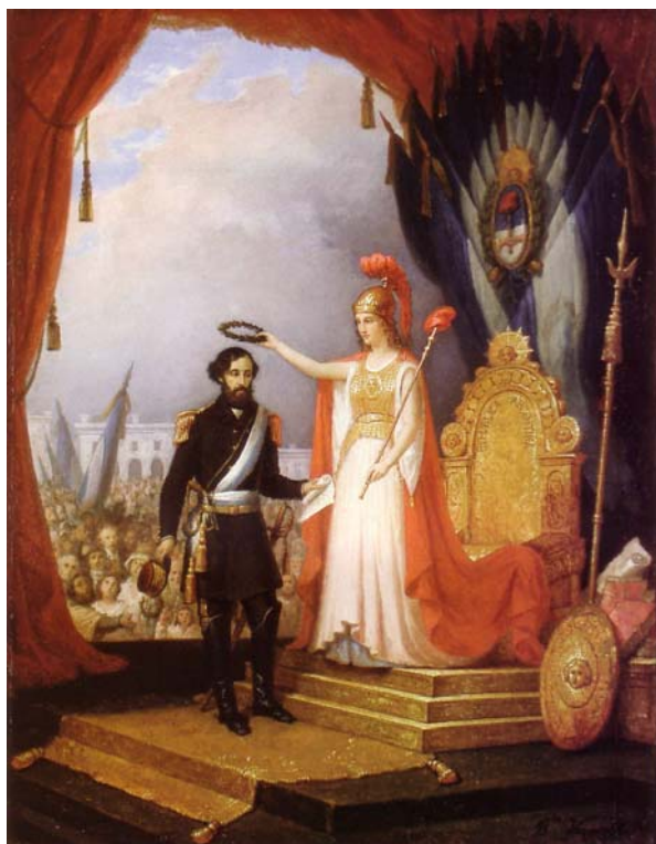
Fig. 13. Bartolomé Mitre. Baldassare Verazzi, 1862, Óleo sobre tela, 45,5 x 37 cm. Colección Horacio Porcel y Sra.

Entre ellos Baldassare Verazzi (1819-1886), pintor italiano que estudió en la Academia de Brera en Milán, con el pintor romántico veneciano Francesco Hayez (1791-1882). Participó en varias exposiciones en Turín y Milán. Se considera obra maestra a Episodio delle Cinque Giornate (Combattimento a Palazzo Litta) , hoy el Museo del Risorgimento en Milán.