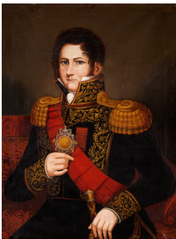
Fig. 10. Retrato de Juan Manuel de Rosas, Cayetano Descalzi, Oléo sobre tela. 97.6 x 75, 3. Circa 1840. Museo Histórico Nacional

La producción plástica de esta época es muy variada y polifacética; parte de la misma se centró en la producción y difusión de la efigie del Restaurador de las Leyes. En este sentido, la obra de Descalzi adquiere una relevancia particular a partir de uno de los retratos al óleo de Rosas, que alcanzó una difusión específica, porque luego fue reproducida en series litográficas destinadas a popularizar la efigie del gobernador de Buenos Aires.