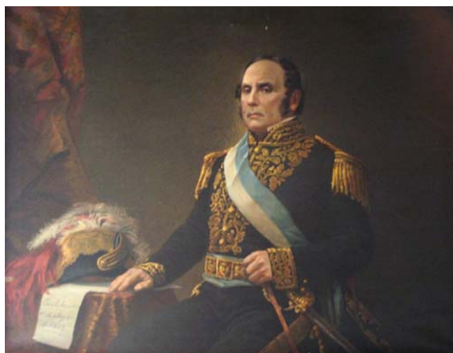
Egidio Querciola, Retrato de Justo José de Urquiza . Tres cuartos de cuerpo, Buenos Aires, 1911. Óleo sobre tela, 130,3 x 100 cm. Museo Histórico Nacional

La amabilidad de Roca. – quería que le hiciera un cuadro en el que apareciera adelante de una carpa, de la misma manera que cuando hizo su famosa campaña. Fue este cuadro el más laborioso de todos .Era un gran carácter el general... 35