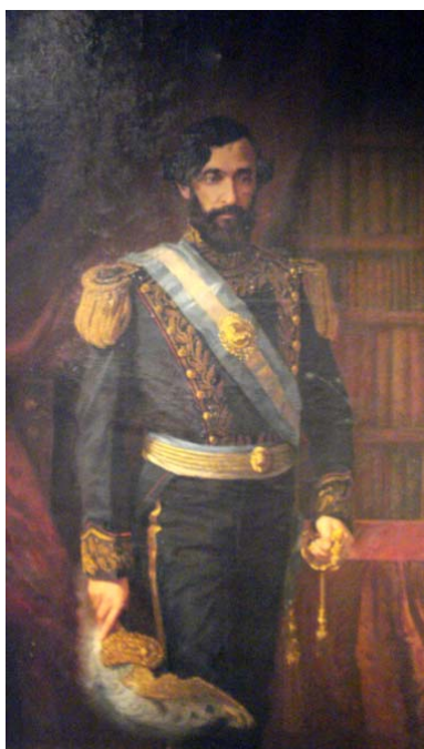
Fig. 19 Retrato del General Bartolomé Mitre. Tres cuartos de cuerpo. Óleo sobre tela Autor: Egidio Querciola, Medida: 94,8 x 160 cm Buenos Aires, 1912 Museo Histórico Nacional

Es de interés en el análisis de este retrato prestar atención a el conjunto bibliográfico que forma parte de la representación que opera a modo de atributo del personaje e indica su condición de bibliófilo y autor de trabajos medulares para la historia argentina que lo llevó a conformar una de las bibliotecas privadas más importante del S. XIX.