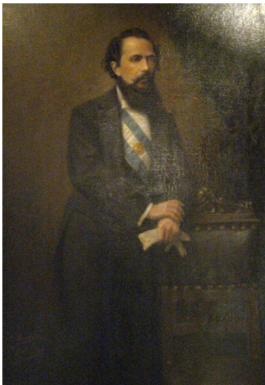
Fig. 21 Retrato de Nicolás Avellaneda. Tres cuartos de cuerpo. Óleo sobre tela. Autor: Egidio Querciola Medida: 100 x 143 cm Buenos Aires, 1914 Museo Histórico Nacional

Avellaneda (1837-1885) periodista y economista se desempeñó como primer magistrado entre los años 1874-1880, a fines de su presidencia, con la denominada Conquista del Desierto (sur pampeano patagónico), el Estado Nacional avanzó en la configuración de sus límites geográficos y sancionó la Ley de Inmigración y Colonización y solucionó el problema de la capital en 1880.