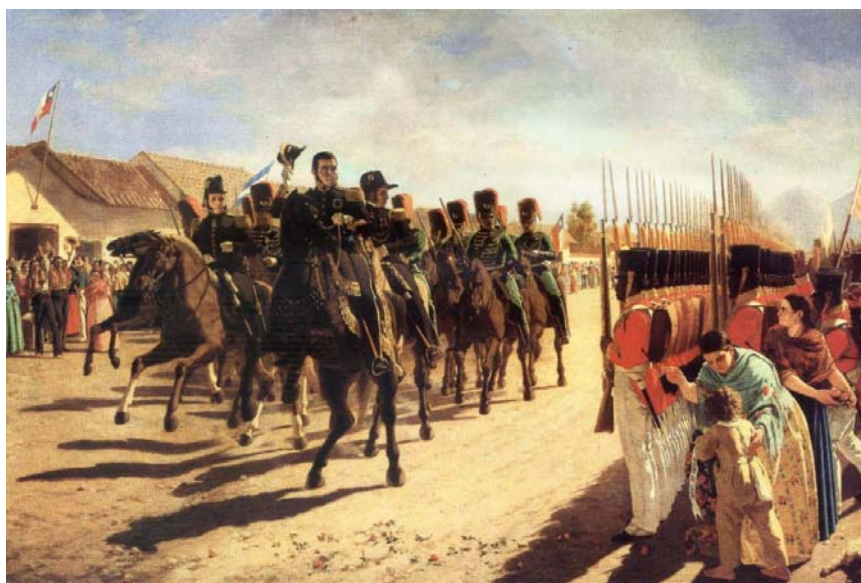
Fig. 15. Juan Manuel Blanes, La Revista de Rancagua , 1872. Museo Histórico Nacional.

Proyectó dos telas de temas históricos de Argentina El fusilamiento de Liniers , El cabildo abierto del 22 de mayo de 1810 , La Conspiración de Alzaga y La Batalla de Maipo que no se concretan. Algunas de las que sí se realizan son El Cabo de Patricios Lorenzo Pío Rodríguez sobre la defensa de Buenos Aires frente a las invasiones inglesas de 1807 15 .