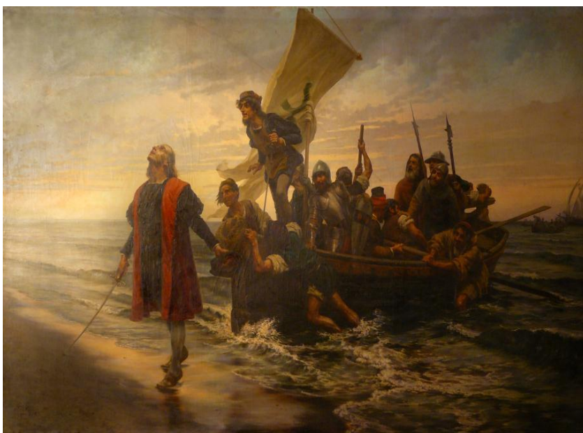
Fig. 18 Pedro Gabrini, Desembarco de Cristóbal Colón , 1892 (MHN). Óleo sobre tela.

Más tarde en ocasión del Centenario de la Revolución de Mayo (1910), el entonces presidente de la Argentina, Figueroa Alcorta, lo recibió como regalo y lo donó al Museo Histórico Nacional.