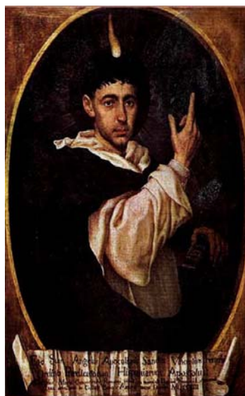
Fig. 5. San Vicente Ferrer, Angel Camponeschi. Col. Museo Isaac Fernández Blanco.

En el primer retrato se destaca belleza en el realismo de su hábito y rostro y singularidad de la factura de sutil perspectiva de la arquitectura del convento. El lego parece estar levitando respecto al convento de Santo Domingo que como paisaje urbano constituye el fondo del retrato, ha sido retratado después de muerto, como parece demostrarlo la palidez del rostro, y su levitación respecto del convento, Como lo señala José Emilio Burucua, esta producción se sitúa en el campo de contradicciones de la transición de la primera modernidad de ilustración católica 8 .