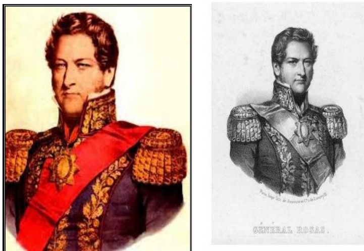
Fig. 9. Retrato y Litografía de Juan Manuel de Rosas. Cayetano Descalzi. Col Museo Histórico Nacional.

en 1845, anunciara aún Descalzi la venta de “ Restauradores Grandes ”. Este fue el retrato oficial de Rosas y el más difundido en el país y el extranjero.