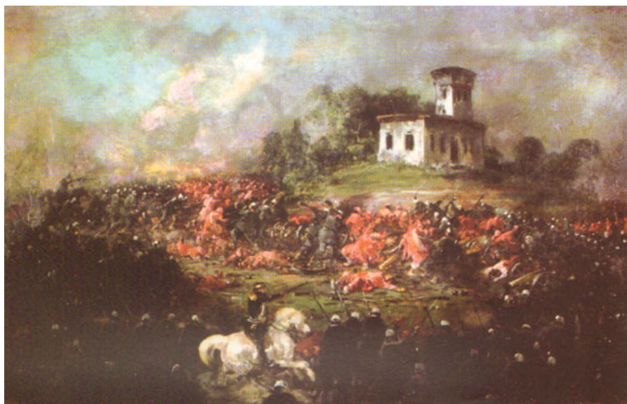
Fig. 14. Ignacio Manzonei, Batalla de Pavón, 1861. Óleo sobre tela 32 x 61 cm. Col. Museo Mitre Colección Horacio Porcel y Sra.

Con estos horizontes, Verazzi arribó a Argentina en 1856, enseñando en su taller, pintado personalidades locales, escenas de la vida cotidiana y pinturas de la historia de los acontecimientos políticos o militares, se vinculó a los grupos mazzinianos militantes en tensión con los sectores conservadores de la colectividad luego regresó a Italia.