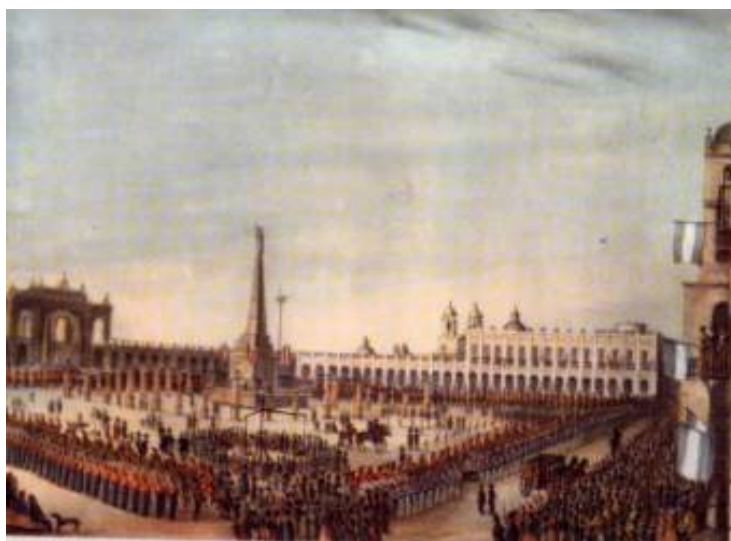
Fig. 8. Alberico Isola. 25 de Mayo de 1844 Lit. Col, 1844, Bonifacio del Carril, Monumenta Iconográfica.

Tres años después Alberico Ísola publica una representación de las fiestas mayas cuya imagen es bien diferente a las propuestas de Pellegrini y podría considerarse complementaria para conocer mejor las celebraciones de la época. Este artista italiano, nacido en 1827 e instalado en Buenos Aires, realizaba litografías sobre dibujos de otros artistas destacados en la época, como Carlos Morel. A los 18 años publicó, bajo su propia firma, el Álbum Argentino , edificios, vistas y costumbres de la Provincia y Ciudad de Buenos Aires, compuesto por diez pequeñas litografías impresas de a dos por página.