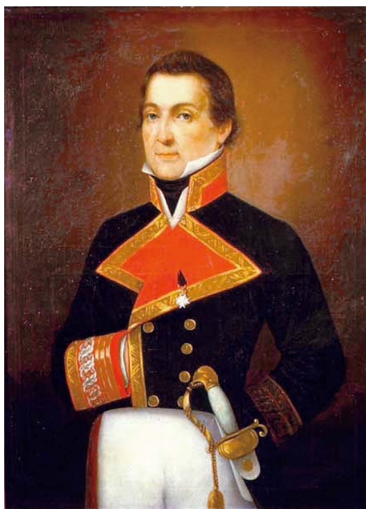
Fig. 1. Comandante Alejandro Malaspina (1754-1809).

heurístico y plástico debió esperar casi dos siglos para ser rescatado y revisitado en valiosas abordajes y ediciones integrales 4 .