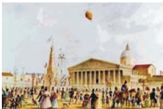
Fig. 7. Carlos Pellegrini, Fiestas Mayas – Buenos Aires, litografía coloreada, 1841, Colección Bonifacio

En efecto, a Carlos Pellegrini le debemos vistas y paisajes urbanos de la Plaza de la Victoria, en los que podemos visualizar edificios emblemáticos como la Catedral, el Cabildo, la Recova y el primer monumento público de la ciudad: la Pirámide de Mayo. En las obras de Pellegrini viven y se registran la sobrevivencia de características impresas por la dominación española, obras de propósito documental. Estas vistas de Carlos Pellegrini se insertan dentro de una de las modalidades del género de los paisajes; a saber, el de las vistas urbanas, que en Europa estuvo vinculado al ascenso social, económico y político de la burguesía.