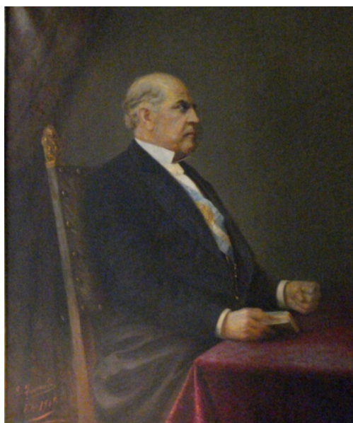
Fig. 20 Retrato de Domingo Faustino Sarmiento. Tres cuarto de cuerpo. Óleo sobre tela. Autor: Egidio Querciola, Buenos Aires, 1913 Medida: 110 x 135,5 cm. Museo Histórico Nacional

El artista hubo de reconstruir sus rasgos fisonómicos, sobre la base de su iconografía previa, que incluía desde óleos, esculturas y fotografías. Asimismo a Eugenia Belín Sarmiento, hija de Domingo, que fuera una retratista de primer orden y a la que se le deben diversas efigies de Sarmiento.