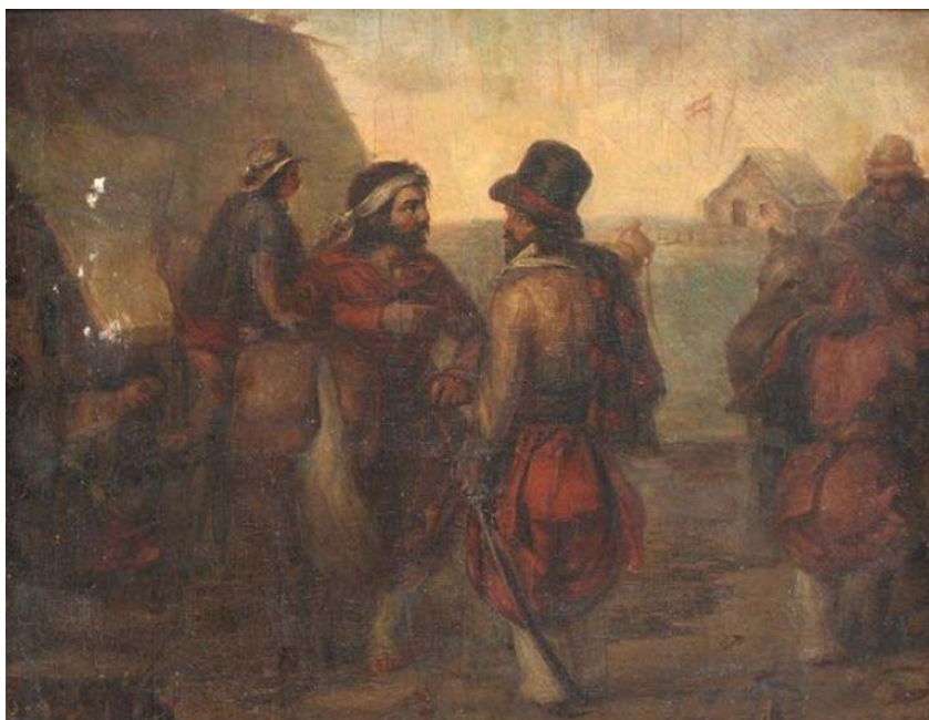
Fig. 12. Jacobo Fiorini, Óleo sobre tela. Campamento de Rosas en Palermo. Museo Histórico Nacional.

Con el fruto de su inserción en el mercado porteño adquirió terrenos en Santos Lugares, donde pasaba largas temporadas y donde lo encuentra una muerte violenta en 1856. Su producción abarca miniaturas y retratos de Juan Manuel de Rosas, del general Gonzalez Balcarce, del Coronel Isidro Quesada, de Fernandez Blanco (Museo Histórico Nacional) y de numerosos protagonistas de la vida social porteña.