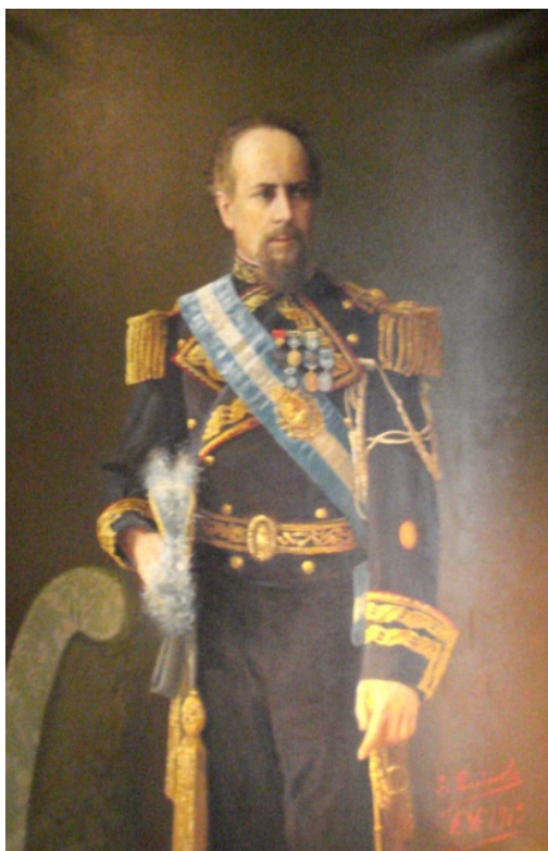
Fig. 22 Retrato del General Julio A Roca. Autor: Egidio Querciola Buenos Aires, 1913 Medida: 105 x 149,5 cm. Museo Histórico Nacional

Julio A Roca fue presidente de la República en dos oportunidades: la primera fue entre 1880-1886 y su segundo período lo cumplió entre 1898 y 1904. Fue la personalidad dominante en la etapa denominada de la República Conservadora (1880-1916); etapa que rebasó temporalmente los años en los que como “Gran Elector” dirigió la política argentina.