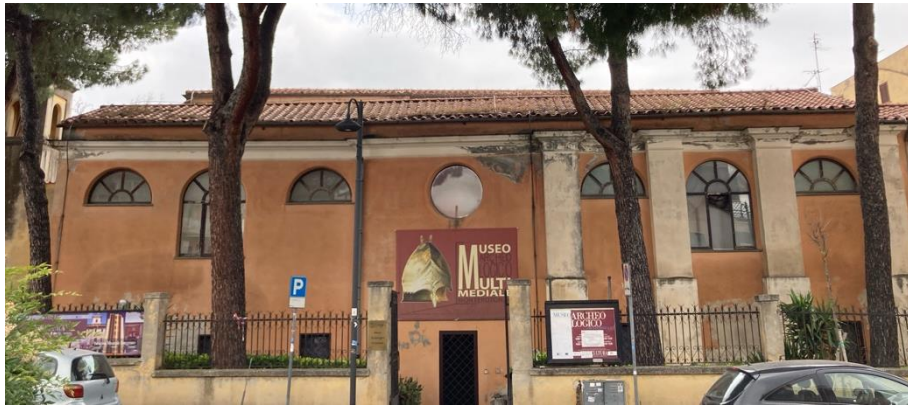
Fig. 5. Prospetto meridionale dell'edificio su viale Giuseppe Serrecchia.