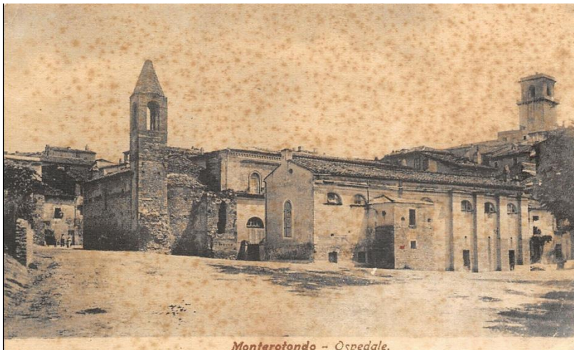
Fig. 2. Il complesso dell'Ospedale e Chiesa di S. Nicola agli inizi del XX secolo.