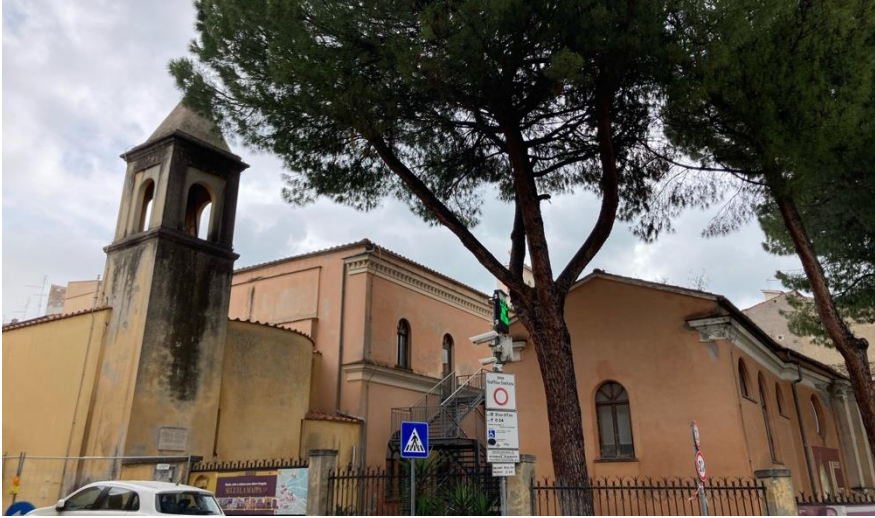
Fig. 3. Il complesso dell'ex Ospedale e Chiesa di S. Nicola nel 2024.