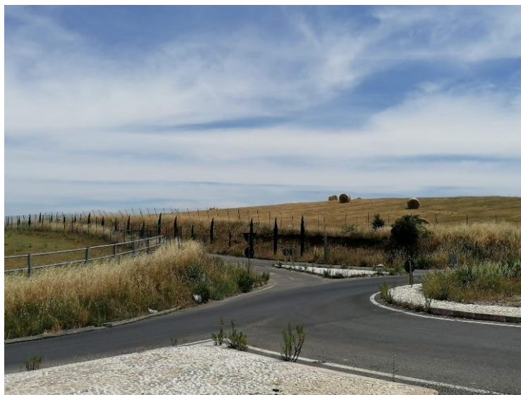
Fig. 7. Località Monte le Pietre.