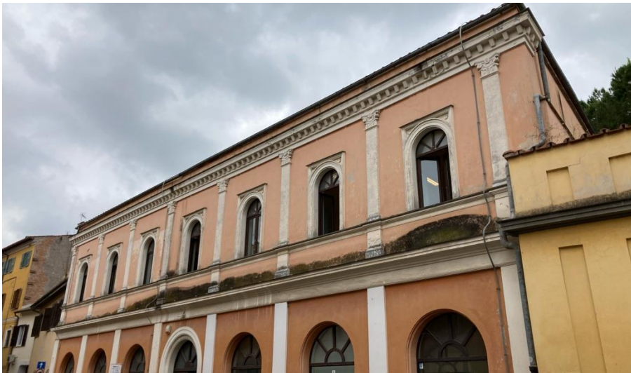
Fig. 4. Prospetto settentrionale dell'edificio su via Arcangelo Federici.