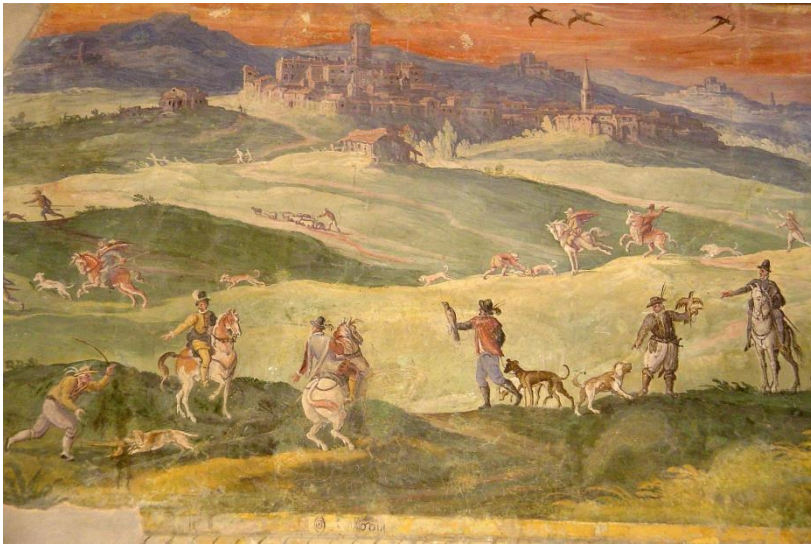
Fig. 1. Paul Bril, Veduta di Monterotondo nel 1581. Stanza con Scene di Caccia, Palazzo Orsini, Monterotondo.