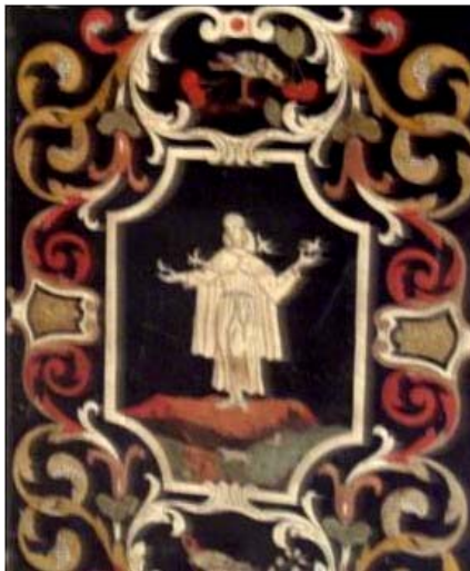
Ilustración 4. Giuseppe Quallio o Giovanni Battista Corbellino (atrib.), Salvador de Horta consuela y alimenta los pájaros , Fonni, Basílica della Vergine dei Martiri, primer cuarto del s. XVIII.