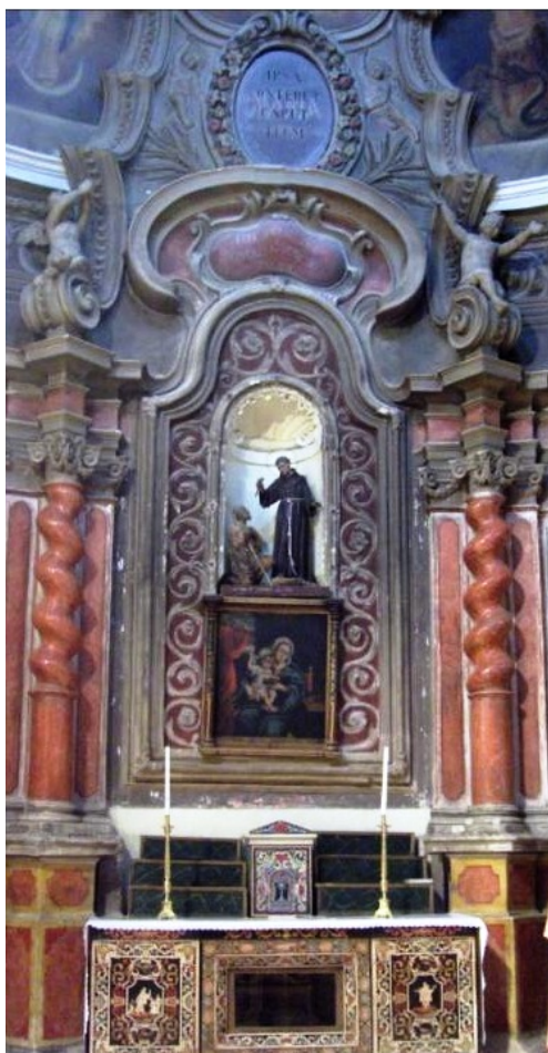
Ilustración 2. Capilla de San Salvador de Horta, Fonni, Basílica della Vergine dei Martiri, primer cuarto del s. XVIII.

grafía de Salvador de Horta, al que dedica una capilla en el nuevo templo (il.2).