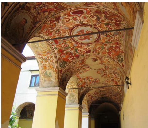
Ilustración 5. Claustro con escenas de la vida de San Salvador de Horta en las lunetas, Orta di Atella, Convento de San Donato, s. XVII.

El conjunto se acaba probablemente en 1692, fecha que aparece en una de las escenas 50 . Entre los episodios representados destacan claramente ocho lunetas con escenas de taumaturgia, que nos introducen al análisis de la iconografía más consolidada del beato.