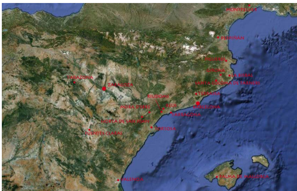
Mapa 2. Mapa de las capillas dedicadas a Salvador de Horta en Aragón, Cataluña, Valencia, Baleares y el sur de Francia, recogidas en la Calaritana Canonizationis de 1709. Elaboración: Francesco Adriano Caredda.

rios se pueden identificar unos focos concretos de veneración más intensa, entre los que destacan Cerdeña y Cataluña, es decir los lugares más directamente relacionados con la biografía del personaje. Pero el mapa documenta la presencia de altares en todos los demás territorios de la Corona de Aragón, es decir: Valencia, Aragón y Baleares, como se verá más adelante (mapa 2).