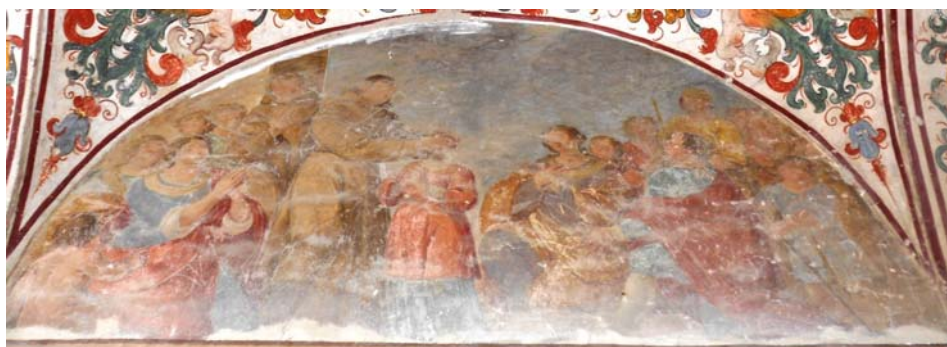
Ilustración 6. Salvador de Horta sana la joven Beatriz , Orta di Atella, Convento de San Donato, s. XVII.

El relato insiste en los diversos pasos de la sanación. En primer lugar, se reclama la fe del creyente y se ratifica la eficiencia de los sacramentos de la confesión y la comunión, como paso previo e indispensable que garantiza la pureza de alma del devoto. Posteriormente se dirige una súplica a la Virgen. Estas acciones, junto con una plegaria pública, crean el clima idóneo para que pueda realizarse el ansiado milagro.