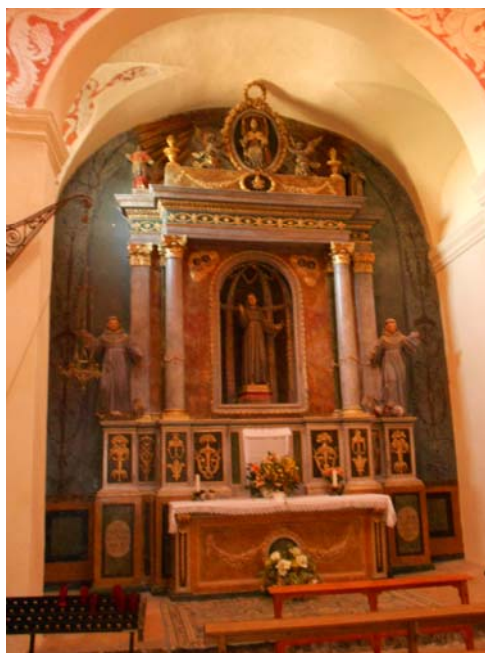
Ilustración 1. Capilla de San Salvador de Horta inaugurada en 1642. Horta de Sant Joan, antiguo convento de Santa Maria dels Àngels.

Los lazos biográficos de Salvador de Horta con su tierra natal se hacen palpables también en la diócesis de Girona, dónde en 1709 se hallan tres capillas en las iglesias de La Bisbal de l'Empordà, Figueres y San Francisco de Girona. La iglesia parroquial de Santa Coloma de Farners alberga también una capilla dedicada al beato Salvador y a San Dalmau Moner 27 .